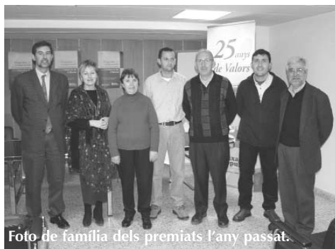
Foto de família dels premiats l'any passat.

• Com va nàixer Guaix? • Vam nàixer després de molts anys d'estar amb la CAPPEPV amb moltes comarques que ara ja tenen coordinadora pròpia, com ara el Guaix a l'Horta Sud (Camp de Morvedre, Horta Nord, Camp de Túria, València ciutat i Horta Sud). Va ser després de la Trobada de Torrent de l'any 98.