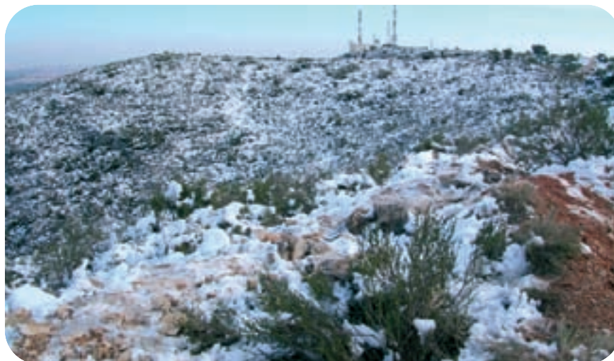
La serra coberta de neu.

A diferència del món de les plantes, on no hi ha la mobilitat d'individus, la fauna té la capacitat de desplaçar-se, i per això, analitzant totes les barres que comporten les vies de comunicació, les tanques de cultius i de xallets i els riscos que afegeixen els espais agrícoles, especialment per l'ús de plaguicides, podem considerar