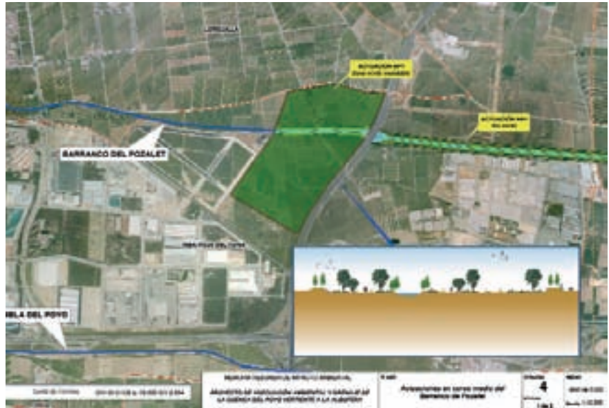
Projecte d'actuacions en el curs mitjà del barranc del Pozolet.

sediments de la conca perquè arribaren de manera directa al mateix estany”, segons les paraules de Sanchis Ibor. En situacions de normalitat, quan ve una riuada els sediments que transporta l'aigua s'escampen per la marjal arrosiera i no es produeix cap destrossa més enllà de problemes a algun camp i trencaments d'algunes séquies, de fàcil reparació. Però si s'aboca tot aqueix carregament de sediments al mateix temps a l'estany, en tres o quatre avingudes d'aigua es podria terraplenar l'Albufera. La canalització creava un conducte que alterava les condicions naturals del barranc. D'aquest projecte només se n'executà una fase, la primera, que era la que afectava Catarroja i Massanassa, principalment. Eren set quilòmetres de recobriment de ciment i ampliació de caixer i que han costat 21.732.597,69 euros, segons la CHX. Segons Carles Sanchis Ibor, “entre Catarroja i l'Albufera sí que s'ha executat d'una manera que era imprescindible.”