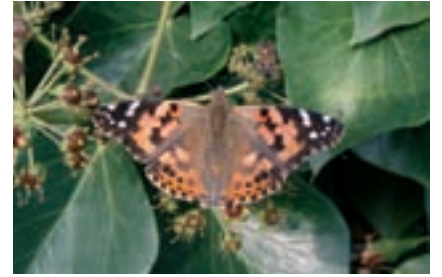
Vanessa dels cards.

Una segona unitat de paisatge és la zona agrícola que arriba fins al vessant de la serra. Tant a la cara nord com a la cara sud trobem una important transformació del terreny per tal de convertir l'antic espai de secà limitant amb la muntanya, amb garrofers i ametlers, en una zona de regadiu amb plantació de cítrics, al llarg d'una bona part del peu de mont, especialment al vessant sud, al terme municipal de Torrent. Un dels problemes ambientals importants de la serra el generen les tanques que apareixen pràctica-