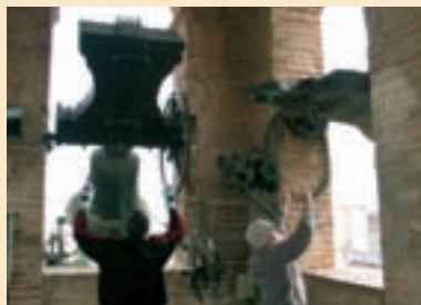
Concert de campanes a Aldaia

Els dies 25 de novembre i 2 de desembre el Museu Comarcal de l'Horta Sud "Josep Ferrís March" va dur a terme un cicle de concerts de campanes a Aldaia i Picassent, que es repetirà durant la tardor dels pròxims anys amb nous concerts fins recórrer les torres de campanes dels diferents pobles de l'Horta Sud. Aquesta activitat s'emmarca dins els objectius generals del museu de promoure la conservació i difusió del patrimoni cultural de l'Horta Sud. En aquest cas es tracta de recuperar la memòria d'un patrimoni immaterial ja oblidat a ran de la desaparició dels últims campaners a la dècada dels anys seixanta. La desaparició d'aquest ofici va estar substituïda per l'electrificació dels campanars, amb la qual cosa es van perdre també molts tocs que acompanyaven la vida quotidiana dels nostres pobles, com ara els d'ànimes, àngelus, etc, alguns dels quals van ser parcialment recuperats en aplicar els ordinadors als campanars a partir dels anys noranta del segle XX, però tractant-se sempre de tocs mecànics.