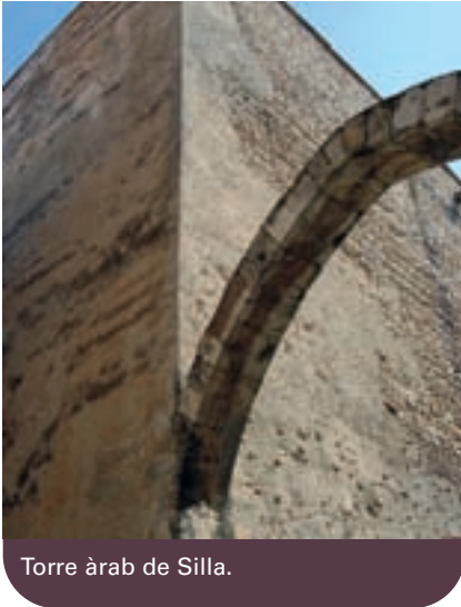
Torre àrab de Silla.

Quan es pretén realitzar una dissertació global respecte de l'arqueologia a l'Horta Sud, se'ns plantegen nombroses possibilitats, ja que es podria realitzar per èpoques, per jaciments, per pobles, per temes, etc. Però crec que aquest primer article ha de mostrar i ser una dissertació global de la situació de l'arqueologia a la comarca, per a descobrir el ric patrimoni que hi trobem. Així, realitzarem una tasca d'investigació documental i bibliogràfica sobre tot allò que hi ha publicat i excavat a la comarca, i intentarem fer una valoració global d'aquest patrimoni amenaçat. Per tant, podem situar els jaciments per èpoques, i la informació extreta realment és sorprenent per la gran quantitat de jaciments existents, en algunes èpoques més abundants que en altres.