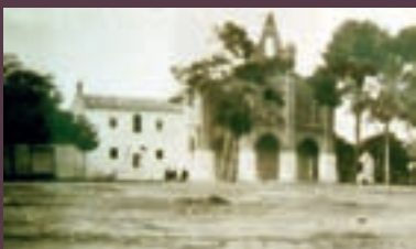
Ermita gòtica de Santa Anna d'Albal.