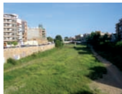
Barranc de Torrent al seu pas per Paiporta.

'Alaquàs i Aldaia. Tots dos pobles han crescut al llarg del segle XX cap al seu barranc. Per exemple, l'estació de tren que ambdues localitats comparteixen està dins del barranc. “Els dos pobles haurien d'haver crescut cap a fora i deixar un buit enmig amb una secció ben ampla perquè poguera passar el barranc”, troba Sanchis Ibor, “però l'errada ja està comesa”.