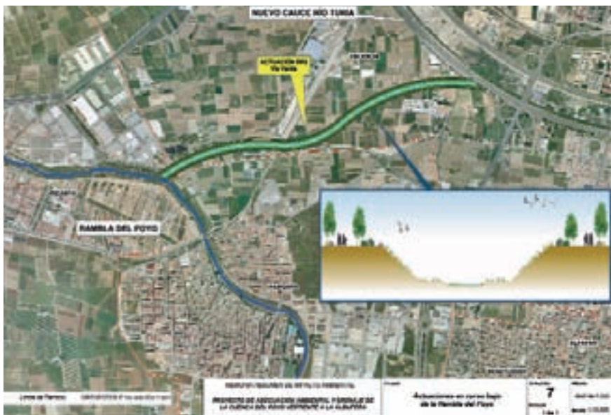
Projecte d'actuacions en el curs baix de la rambla de Poyo a Picanya.

El barranc de Torrent té moltes possibilitats de convertir-se en un pulmó verd que vertebrarà una gran part de l'Horta Sud.