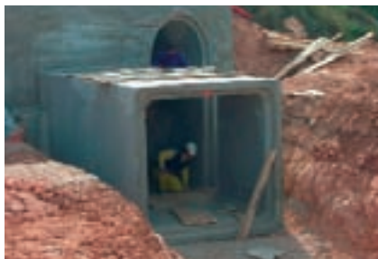
Obres d'ampliació del cunetó del Distribuïdor Sud a Aldaia.

un funcionament administratiu o d'urbanisme més important ", recorda Sanchis Ibor. A banda, el fenomen no havia estat tan intens fins a després dels anys 60. Cal tindre en compte que abans d'aqueixa data no hi havia un desenvolupament urbanístic que fóra problemàtic. El Pla de Quart estava constituït pràcticament per garroferes. És a partir dels 70 quan s'intensifica aqueix urbanisme i el conflicte es fa més evident. Tant per urbanització com per infraestructures.