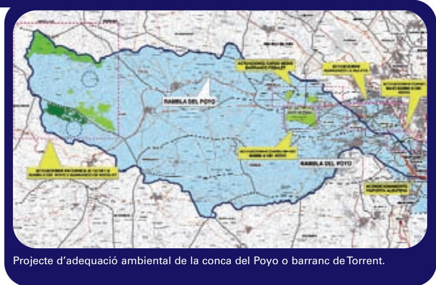
Projecte d'adequació ambiental de la conca del Poyo o barranc de Torrent.

En 2007 es compleixen 50 anys de la fatídica riuada de 1957 que assolà València i l'Horta. En aquesta inundació es desbordaren el Túria i els barrancs de la comarca, provocant pèrdues humanes i danys materials. La construcció del nou llit del Túria, l'anomenat 'Plan Sur', ha resolt el problema de les riuades per a la capital, però l'Horta Sud encara viu sota l'espasa de Damocles de les avingudes dels barrancs de la conca de Poyo.