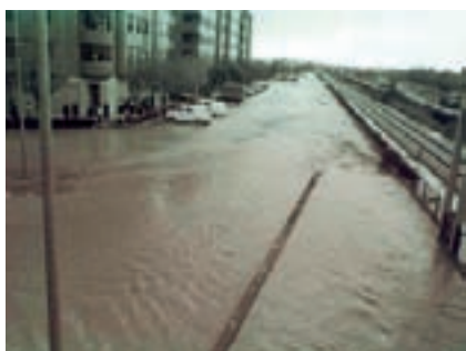
Riuada de l'any 2000 a Aldaia.

Així mateix, la contaminació i la invasió d'altres espècies han afectat molt la coberta vegetal del barranc, però encara s'hi pot trobar una rica varietat de flora i vegetació. Heus-ne ací una xicoteta mostra. A l'entorn de Torrent l'alzina, el baladre, l'esbarzer, la murta i el fenoll; Entre Picanya i Catarroja, l'alber piramidal, el pi blanc i la figuera; i en la marjal de l'Albufera, el card, l'olivarda i la calèndula.