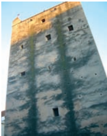
Torre de Torrent, on s'han fet excavacions que han tret a la llum el fossat medieval.

xemple, solament comentaré que alguns pobles sí que tenen aquest pla, com ara Catarroja, Benetússer, Silla, entre altres. Les actuacions realitzades al castell palau d'Alaquàs o a l'ermita de Santa Anna d'Albal ens permeten conèixer millor el nostre passat, i aquesta ha de ser la tònica constant de l'arqueologia als nostres pobles.