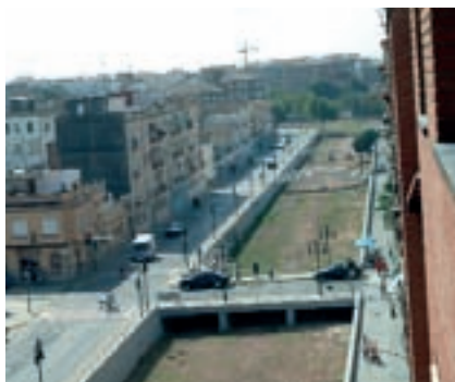
Barranc de la Saleta al seu pas per Aldaia.

Quan parlem del barranc de Torrent -o de Catarroja, o de Xiva, o dels Cavalls- ens referim a un sistema hídric format per un conjunt de rambles que organitzen el drenatge entre les conques dels rius Túria i Xúquer, l'anomenada conca de Poyo. El fet que es desborde amb tanta facilitat és perquè té una conca prou gran. La conca del barranc de Torrent arriba a la serra de Los Bosques, al nord de Xiva, i rep les escorrenties de la serra Perennis. Per això totes les precipitacions