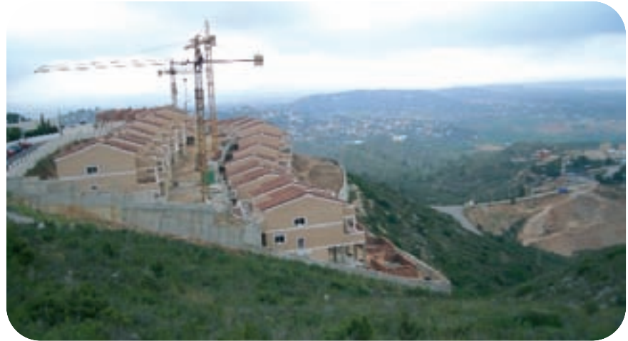
Xalets al cim del Pla del Toxar.

El camí de la Serra, pista que recorria la serra d'est a oest, i de la qual encara queden alguns trams utilitzables, no ha sigut una via de pas o de trànsit d'una zona a l'altra, ja que és més fàcil rodejar-la amb camins plans. L'obertura ha estat motivada pel fet de poder arribar amb més facilitat a l'interior i a les zones altes de la serra, per utilitzar eixe territori de manera diversa.