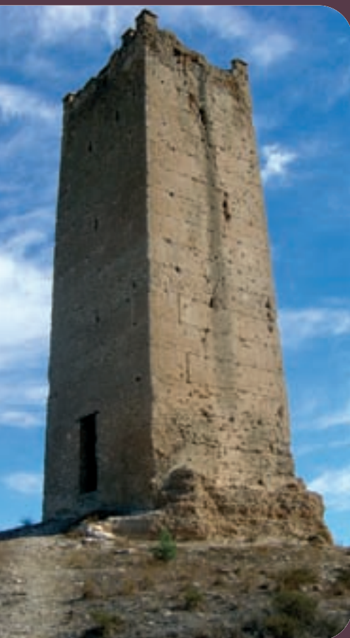
Torre islàmica d'Espioca a Picassent.

Una de les tasques actuals de l'arqueologia és la industrial, que arreplega i estudia els vestigis contemporanis relacionats amb les factories dels segles XVIII, XIX i part del XX.