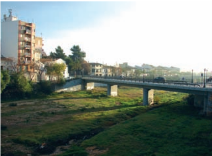
Barranc de Torrent dins de Picanya.

que cauen al Pla de Quart (Alaquàs, Aldaia, Quart de Poblet...) i a la zona de Xest i Xiva, acaben al barranc. “És una àrea relativament extensa i per això, en una zona en què durant els mesos d'octubre i novembre es poden produir precipitacions importants, la conca pot manifestar el que denominem respostes d'inundacions llamp, ço és, molt ràpides”, explica el geògraf Carles Sanchis Ibor, del Centre Valencià d'Estudis del Reg (CVER). “En una zona en què les precipitacions anuals són fluïxes, en un dia poden caure fàcilment més de 100 litres per metre quadrat o 200”, afegeix Sanchis Ibor. I per això el barranc es desborda amb tanta força.