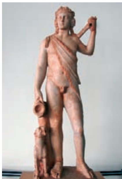
Bacus d'Aldaia, escultura romana trobada al jaciment de l'Ereta dels Moros.