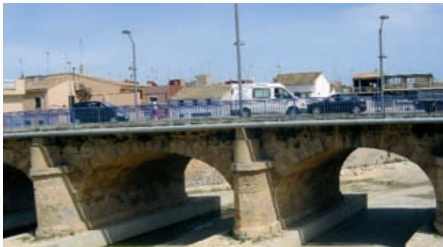
Zona canalitzada del barranc de Torrent al terme de Catarroja.