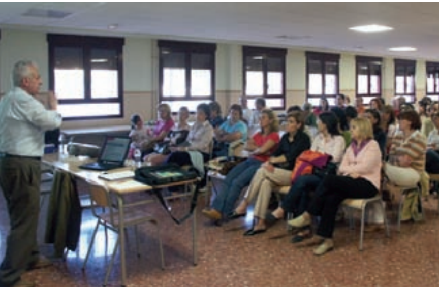
Jornada celebrada per FAPA a Picanya.

Aldaia, Picanya i Paiporta han acollit enguany jornades i cursets del col·lectiu de l'Horta Sud de la Federació d'Associacions de Mares i Pares de l'escola pública i concertada.