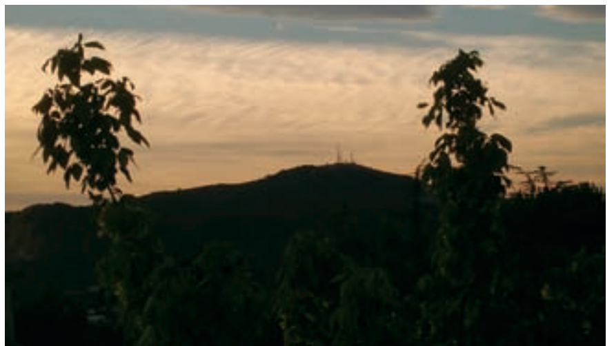
La serra de Perenxisa al vespre.

També hom pot trobar a la serra l'etapa més degradada en la successió vegetal: la timoneda, on les espècies més representatives són plantes aromàtiques de port menut i de tija llen-