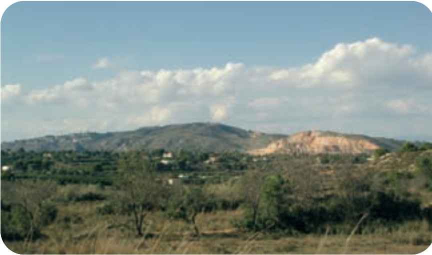
Vista de la serra de Perenxisa.

Entre els rèptils cal destacar les espècies de colobres, com la serp blanca ( Elaphe scalaris ) i la serp de ferradura ( Coluber hippocrepis ) i també les de sargantanes, com és la sargantana cuallarga ( Psammotromus algirus ) i la sargantana cendrosa ( Psammotromus hispanicus ). La serra Perenxisa és també l'hàbitat del fardatxo ( Lacerta lepida ), i de la bivia ibèrica ( Chalcides bedriagai ), espècies cada vegada més escasses.