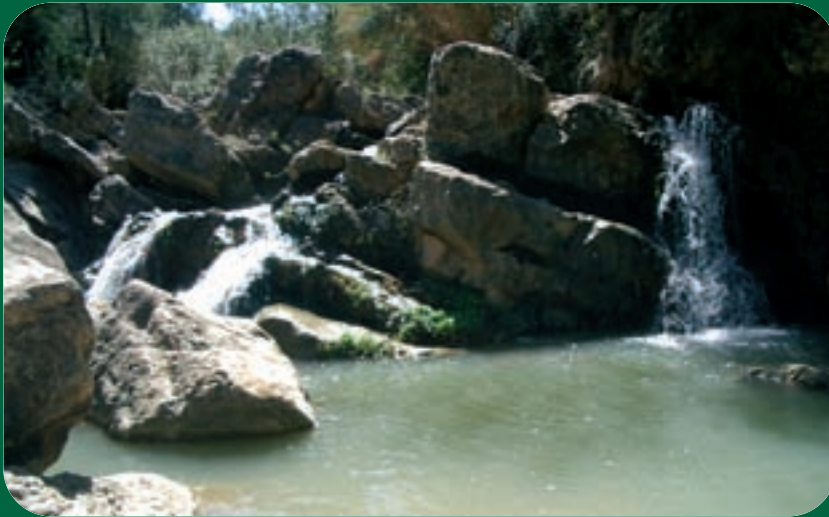
Barranc de Gallec.

L'Horta Sud es caracteritza per ser bastant plana i amb una orografia molt discreta. Només als termes de Picassent i de Torrent és on trobem muntanyes de poca elevació que són espais encara poblats per una vegetació natural i on hi ha zones apartades de l'activitat humana, on la fauna gaudeix d'una certa tranquil·litat i disposa d'hàbitats bastant ben conservats.