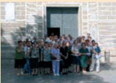
Visita a l'ermita de la Vallivana de Picassent

El dissabte dia 30 de setembre el Museu va celebrar un any més les Jornades Europees de Patrimoni. Continuant el recorregut iniciat any enrere per les poblacions de la comarca. Enguany l'itinerari en autobús ha visitat Alcàsser, Picassent i Alfafar. En Alcàsser es va visitar l'església parroquial de Sant Martí, del segle XVII amb pintures atribuïdes a Vicente López, i el Mercat Municipal, edifici construït l'any 1927 i un dels més singulars d'aquesta tipologia que encara es conserva a la comarca. Tot seguit, a Picassent es va visitar l'ermita de la Vallivana, construïda al segle XVIII i la torre d'Espioca, edifici d'època islàmica declarat Bé d'Interès Cultural que, amb altres torres de la comarca, formava part del cinturó de torres de guaita que defensaven la capital. Per últim l'itinerari va finalitzar a Alfafar on els participants van visitar el casino del Centre Recreatiu, l'antic casino del Sindicat Arrosser, ara rehabilitat com a Biblioteca Pública i declarat Bé d'Interès Cultural, i la parròquia de la Mare de Déu del Do, amb la imatge gòtica de la Mare de Déu.