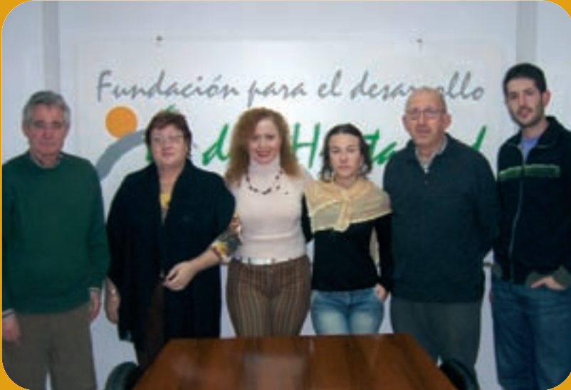
Premiats del programa Solidaritat Internacional.