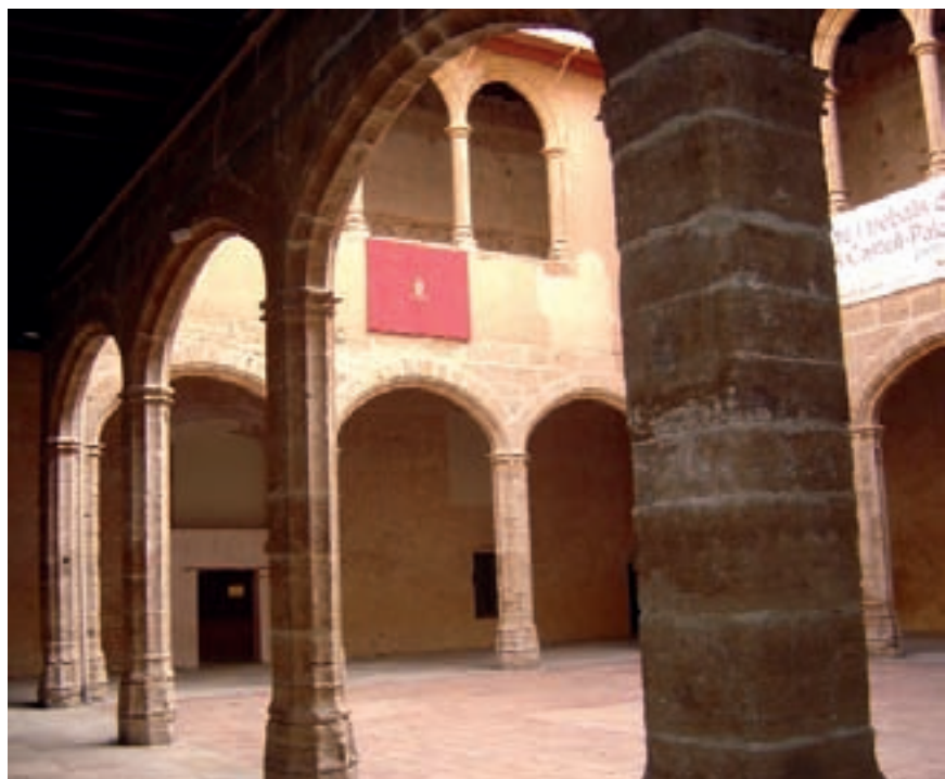
Pati del castell d'Alaquàs.

Entre els assentaments més antics de la comarca, ço és, adscrits a la prehistòria, solament en tenim a Torrent i a Picassent en les primeres elevacions muntanyenques. Aquests estan adscrits a l'època del bronze, amb una clara vinculació a la possibilitat de ser bronze valencià.