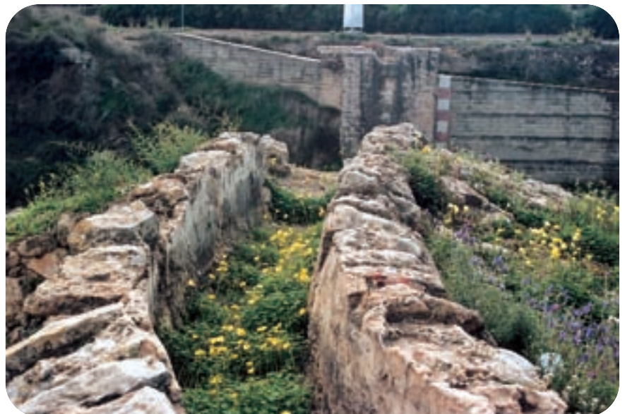
Restes del caixer de l'antiga Séquia de les Fonts d'Alcàsser i Picassent.

La llista de jaciments arqueològics és important, especialment d'època romana, quan el poblament de la comarca fou important a causa del naixement i la fundació de la ciutat de València ( Valentia ) l'any 138 aC. Aquesta dada suposa l'arribada de persones al seu entorn i per tant la fundació de poblats o vil·les romanes com les coneixem. Podem dir, doncs, que els romans són els primers que ocupen la part baixa de la comarca, és a dir, la zona més marjalenca o d'horta per tal d'explotar les terres fèrtils que hi havia. Però abans dels romans ja tenim poblacions i habitants a les nostres terres. Les cultures del bronze i ibèriques ja tenien poblats als voltants de la plana, amb assentaments situats en les primeres elevacions