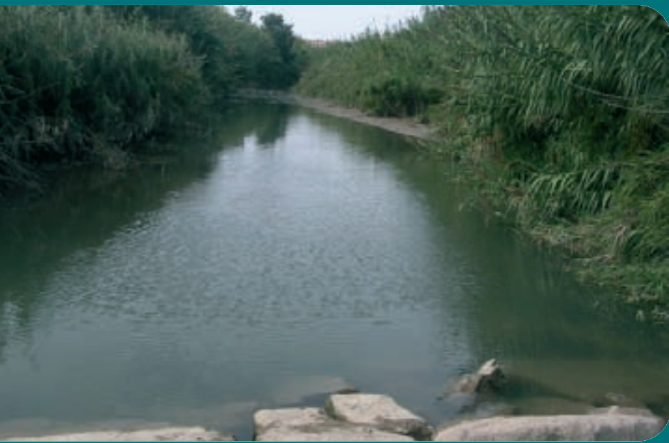
Imatge del riu Túria al terme de Manises.