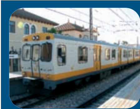
Tren de la línia 1 del metro.

L' accident del metro a València el 3 de juliol de 2006, que es va saldar amb la mort de 43 persones, moltes d'elles de l'Horta Sud, ha obert el debat sobre la seguretat i qualitat de la xarxa del transport públic metropolità i la necessitat urgent de més inversions per part de l'Administració. Es tracta de línia 1 del metro que comunica València amb les poblacions de Paiporta, Picanya, Torrent i Picassent. Aquell fatídic dia d'estiu un tren que tenia 18 anys d'antigüitat va descarrilar en una corba situada entre les parades de la plaça d'Espanya i Jesús, produint el major accident de metro en àrea urbana ocorregut a Espanya.