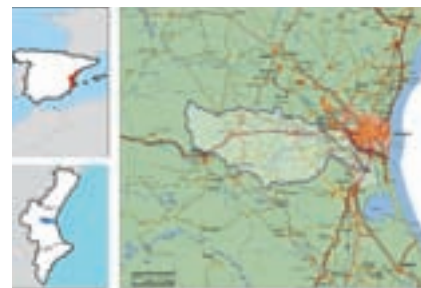
Mapa de la conca hidrogràfica del barranc del Poyo.