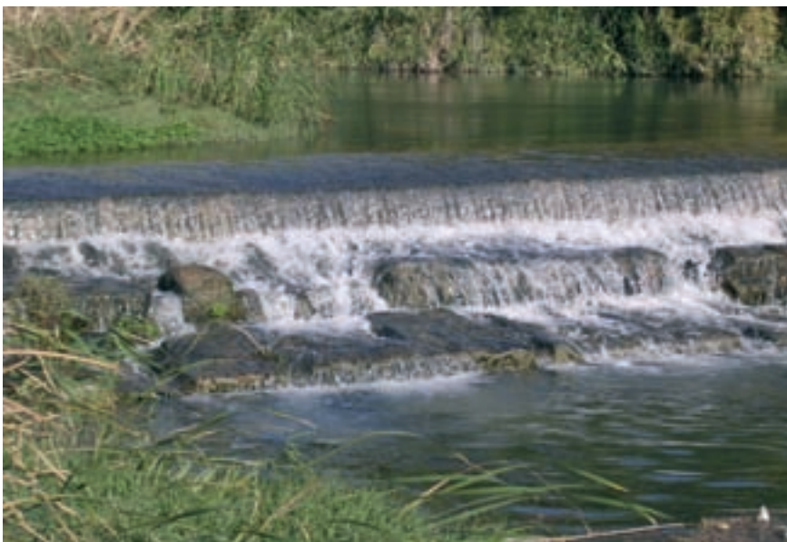
Assut del riu Túria.