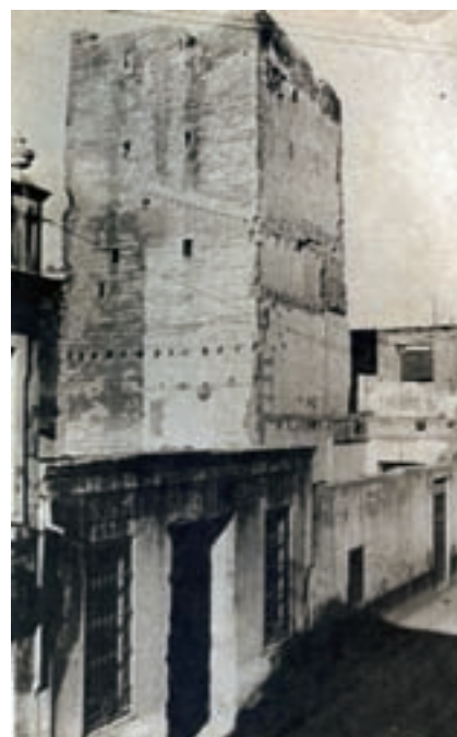
Antiga torre islàmica d'Alcàsser, hui desapareguda.

Per motiu d'estar localitzats i senyalitzats com a assentaments ibèrics coneixem dos jaciments a Torrent, exactament amb el nom de la Llometa del Clot de Bailon i la Lloma del Birlet.