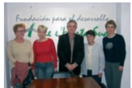
Guardonats del programa d'activitats interassociatives.

Colectivo Benjamín Mejías del Departamento de San Salvador-Teotihuacan y la Libertad de El Salvador. Subvencionat també amb 2.000 euros, el projecte col·labora en la construcció d'una unitat educativa experimental de Paracaya dirigida a la població infantil. ■