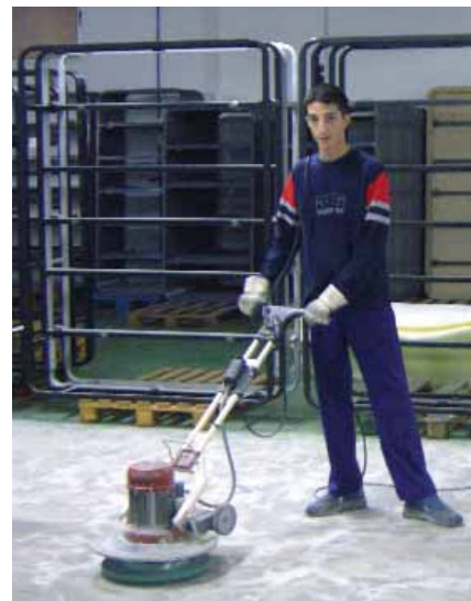
Operari de neteja.