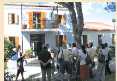
Jornada de Patrimoni.

Més informació sobre les activitats del museu: