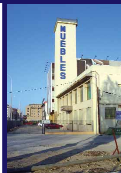
Les fàbriques de moble s'han vist obligades a modernitzar les seues estructures per fer front a la crisi.

A més del sector del moble, en els darrers anys a l'Horta Sud té un gran dinamisme la construcció. Existeixen 2.097 empreses relacionades directament amb aquesta activitat. També en els últims temps destaquen les empreses relacionades amb els serveis socials prestats a la comunitat amb un increment de 236 empreses en els tres últims anys. I és que en el que portem de segle XXI el sector terciari ha experimentat un augment destacat en el conjunt de l'economia comarcal a causa del desenvolupament del sector públic i la saturació del sòl a la ciutat de València, fet que ha obligat a ocupar espais de municipis de la comarca per ubicar nous serveis que abracen tota l'àrea metropolitana.