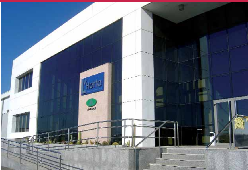
Façana del nou magatzem del consorci.

cions al polígon Mas del Jutge de Torrent, abandonant la seu de San Luis Beltrán. El nou magatzem del Consorci de l'Horta ocupa una superfície de 50.000 m 2 amb 22.000 m 2 construïts. Es va inaugurar el passat 16 de desembre de 2004 en un acte que comptà amb la presència del president de la Generalitat, Francisco Camps.