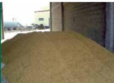
L'arròs es buida a l'era.