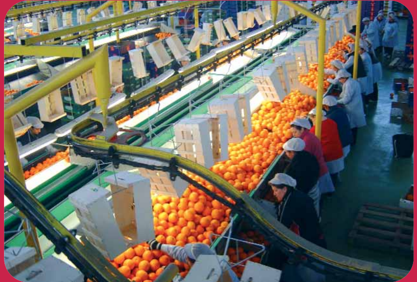
Instal·lacions del Consorci Cooperatiu de l'Horta al polígon Mas del Jutge de Torrent.

“La unió fa la força”, una vella dita popular que sovint acaba convertint-se en l'estratègia elemental de molts projectes econòmics. Una premissa que ha aplicat el Consorci Cooperatiu de l'Horta, una entitat nascuda de la fusió de les cooperatives agrícoles de Torrent, Massanassa, El Puig i Vega Horta Nord de València. La cooperació entre cooperatives per a sobreviure en el mercat globalitzat. El consorci té en l'actualitat 1.500 socis, produeix 45.000 tones anuals de productes hortofruiters i factura cada l'any més de 21 milions d'euros.