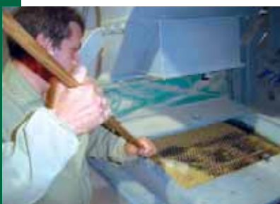
Operari movent el gra.