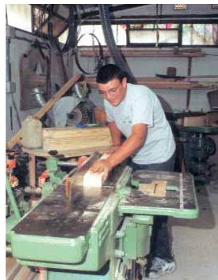
Treballador del moble.