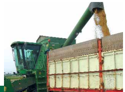
Procés mecanitzat de la sega de l'arròs amb recolectora.