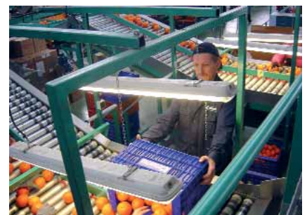
Operari descarregant taronja.