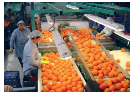
Línia de producció cítrica.

El consorci té com a objectiu fonamental la concentració de la producció hortofruitera i la seua comercialització per tal d'aprofitar recursos humans i economies d'escala. Les cooperatives agràries de l'Horta Sud hagueren d'associar-se per a sobreviure al mercat.