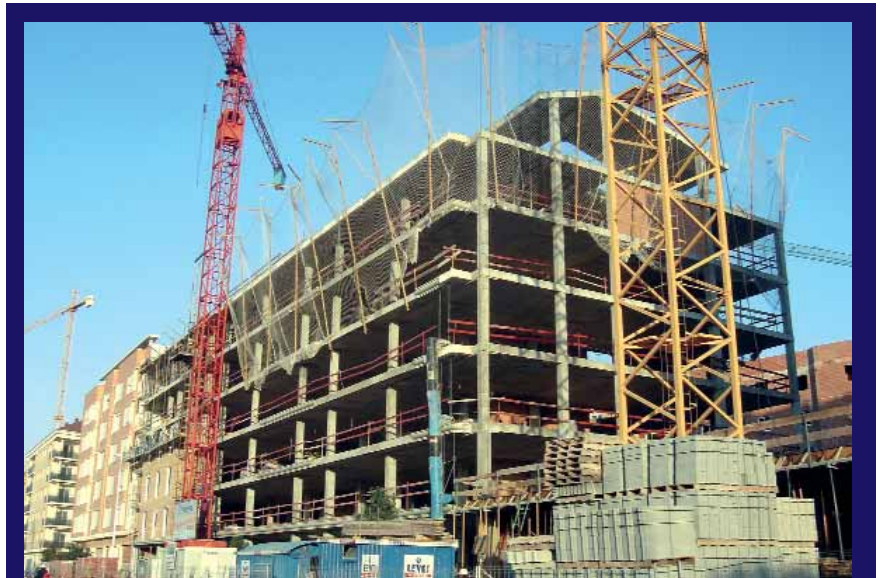
La construcció s'ha convertit en un negoci en expansió a la comarca.

El sector manufacturer representa el 28% del total d'empreses de l'Horta Sud. La major part d'aquestes indústries es dediquen al moble, la fusta, als productes metall mecànics i a la indústria d'alimentació, begudes i tabac. L'Horta Sud és el principal productor de mobles d'Espanya i un dels primers en ceràmica decorativa. Per municipis, la principal indústria manufacturera és el moble a Alaquàs, Albal, Alcàsser, Aldaia, Alfafar, Benetússer, Beniparrell, Massanassa, Païporta, Catarroja, Sedaví i Silla. Encara que també és important la indústria del moble a Quart i Picassent, aquests dos municipis destaquen a més per la construcció, el comerç i l'hostaleria. Xirivella es caracteritza per una organització industrial relacionada amb l'alimentació, la fabricació de productes metàl·lics, la construcció i el comerç. Picanya, per altra part, té una configuració industrial prou diversificada on destaca el comerç i la construcció. Torrent també presenta una estructura diversa amb major importància la fabricació de productes metàl·lics excepte maquinària i equip, la construcció, el comerç i l'hostaleria. A Manises predomina la ceràmica, la construcció i el comerç, mentre