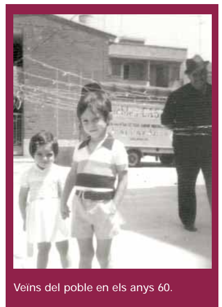
Veïns del poble en els anys 60.

Al centre urbà, junt a la molt senzilla i moderna casa Consistorial, s'eleva l'Església, un edifici envoltat per tres parts per dos carrers i per l'altre per un espai lliure amb algunes palmeres que la separen de l'Ajuntament. És obra de mampost i taulellets, en les zones destacades on hi ha també elements decoratius. Coberta a dos aigües per teulada àrab al seu interior estan les imatges del Sagrat Cor, de la Immaculada i del Bon Pastor, acompanyen també un llenç de la Sagrada Família i Sant Joan. A aquesta església se celebren al mes de juny les festes del Corpus. On participen tots els veïns i veïnes i on es rememora la fundació del municipi més menut de tot Espanya. ■