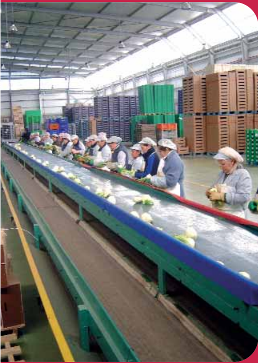
Línia de producció d'hortalisses.