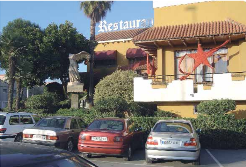
L'hostaleria, sobretot els restaurants, s'ha convertit en un sector puixant.

Per afrontar amb èxit aquests canvis les empreses de l'Horta Sud han de seguir estratègies, com per exemple convertir-se en proveïdores especialistes de grans distribuïdores amb productes amb un valor afegit: el servei i la qualitat.