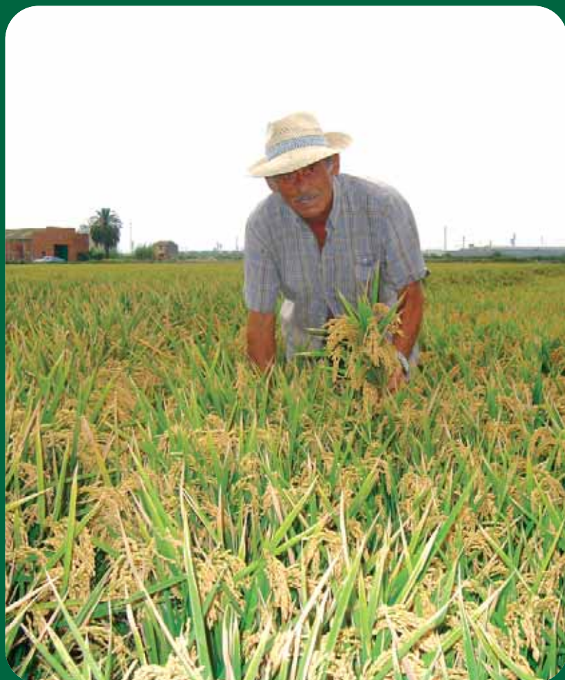
Llaurador en un camp d'arròs d'Alfàfar. (F. Martínez)

L'arrossar configura un paisatge singular a l'Horta Sud, al voltant de l'Albufera. Aquest espai agrari conforma també una cultura, una economia i una manera de viure. El Parc Natural de l'Albufera camina de la mà de l'arròs, l'un no existiria sense l'altre, i la conjunció entre els dos acaba convertint-se en un bé paisatgístic que cal protegir.