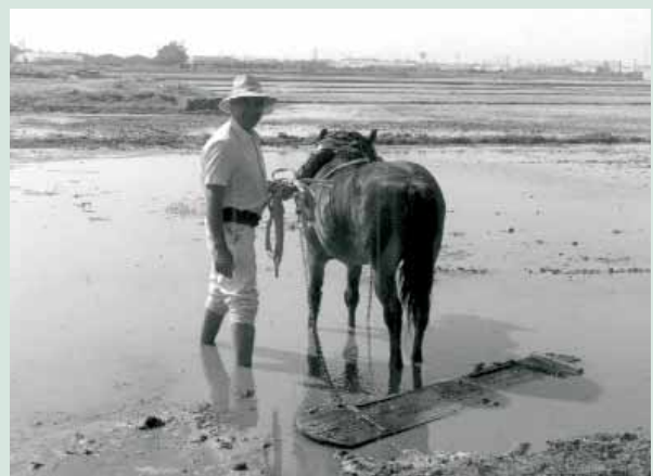
El llaurador usava entauladores de fusta per a nivellar la terra. (R. Martínez)