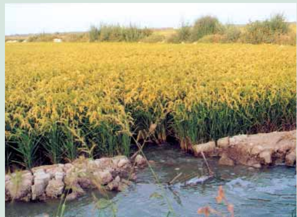
El cultiu de l'arròs és una autèntica cultura de l'aigua.

Els motors són autèntics reguladors del nivell d'aigua de l'arrossar. En primavera inunden els camps per a la plantà, que té lloc en maig. Aquest nivell es manté pràcticament inalterable però amb aigua renovada fins a l'estiu, quan l'arròs ja ha madurat. Unes setmanes abans de la sega (que es fa a setembre) el pro-