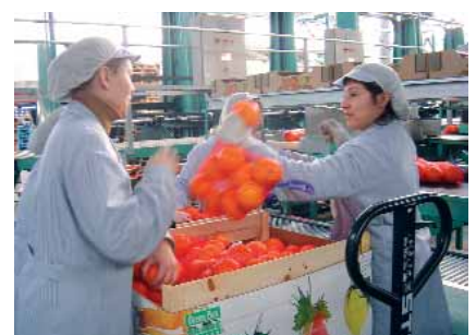
Treballadores envasant fruita.