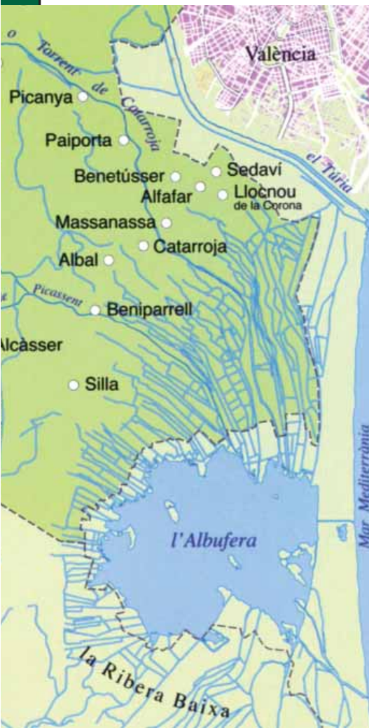
Set pobles de l'Horta Sud estan integrats al Parc Natural de l'Albufera. (Mapa IDECO).

del llac està lligada indestriablement al cultiu de l'arròs. Hi ha set pobles de la comarca on es cultiva aquesta planta gramínia. Són Silla, Beniparrell, Albal, Catarroja, Massanassa, Alfafar i Sedavi.