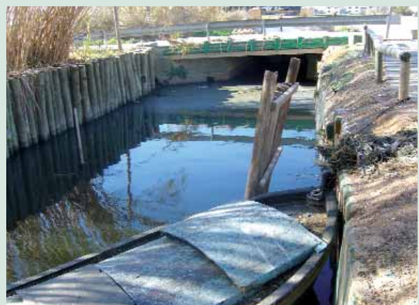
Sèquia contaminada de la marjal de Catarroja.

R esulta recurrent denunciar-ho tantes vegades, però la dura realitat s'imposa. El verí que està matant l'Albufera són les aigües residuals industrials i urbanes que arriben diàriament per nombroses sèquies i tuberies no connectades a cap depuradora. El resultat tots els coneguem: una contaminació de les aigües que lluny de parar s'incrementa. El sistema de sanejament i depuració del Parc de l'Albufera iniciat en 1985 per la Generalitat i el Govern central ha resultat lent i insuficient. La pressió industrial i l'augment de la població de l'Horta Sud i la ciutat de València han fet insuficient la xarxa de sanejament que arriba al llac. Un exemple: des de 1998 han obert 1.164 noves indústries a la comarca, la qual cosa suposa un increment d'un 38% de l'activitat industrial. La solució passa per la construcció de més depuradores i col·lectors que separen les aigües pluvials de les residuals. El parc natural valencià més emblemàtic està agonitzant per a vergonya dels nostres governants, que no dubten en fer inversions milionàries i deficitàries en projectes turístics com Terra Mítica o la Ciutat de les Ciències. Resulta con-