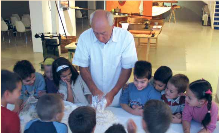
Taller per a aprendre a pastar i fer pa.

D urant el segon semestre de l'any 2004 el museu ha continuat desplegant la seua programació de difusió cultural, on s'han realitzat les següents activitats: