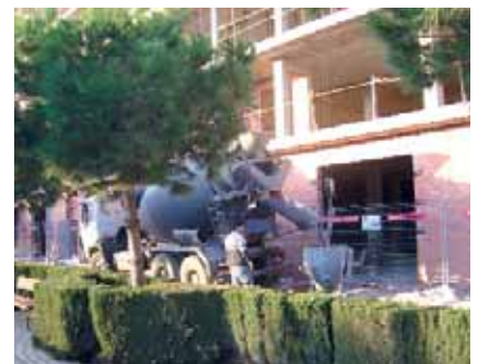
El 12% de les empreses de l'Horta Sud es dediquen a la construcció.