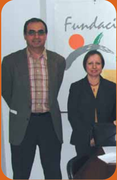
Membres de l'Associació del Barri del Crist.

Han sigut molts guanys aconseguits, com ara la construcció d'una passarel·la en l'A-3 en 1975, la creació de vivendes socials, la construcció d'un ambulatori i més recentment la millora del servei d'autobusos al barri.