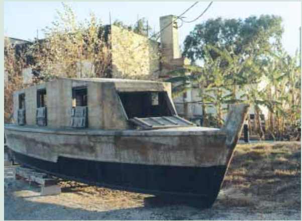
Antiga barca del Port de Catarroja en procés de reparació.

L'arrossar de l'Albufera té dos sectors ben diferenciats. Per una banda els "tancats", arrossars situats al litoral del llac on la inundació dels camps depén del nivell de la llacuna. D'altra banda l'arrossar de terres altes que envolta el sector anterior, inundat principalment d'aigua procedent del Xúquer i Túria. Els "tancats" es van guanyar l'Albufera amb els històrics aterraments, que van minvar el llac en unes 10.000 hectàrees. Aquest fenomen es va desenvolupar fonamentament durant la segona meitat del segle XIX i les tres primeres dècades del XX. A Catarroja i Silla els aterraments van moure l'economia agrària local durant molts anys. L'últim tancat de Catarroja fou el de la Pipa, l'any 1918. Actualment encara viuen alguns vells barquers que en la seua infantesa ajudaren als seus pares a fer "tancats". Els aterraments han quedat immortalitzats en la literatura de la mà de Blasco Ibáñez en la novel·la Cañas y Barro . I a principis del segle XX van ser motiu d'un acalorat debat social i polític. El diari El Pueblo , fundat per Blasco Ibáñez, es va destacar per la denúncia sistemàtica dels aterraments i exigia a les autoritats de