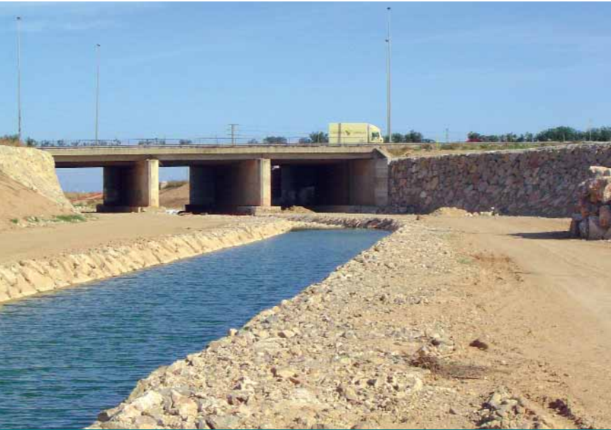
Obres actuals de canalització del barranc de Poio als termes de Catarroja i Massanassa.

En el nou document presentat, la Confederació proposa una solució integral contra inundacions en la que estiguen d'acord totes les poblacions afectades i que siga compatible amb la preservació del Parc Natural de l'Albufera.