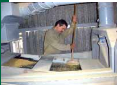
Secat mecànic de l'arròs.