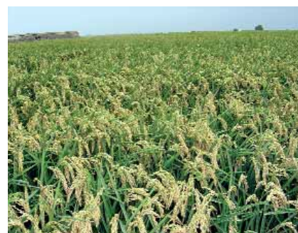
L'arrossar ocupa 14.000 hectàrees a l'Albufera.

Aquesta celebració ha servit per a reforçar el lligam dels valencians i valencianes amb l'arrossar i per a plantejar-nos noves polítiques de suport a aquest cultiu en el marc de la Unió Europea. Però cal destacar que els objectius conservacionistes de l'ONU ja fa alguns segles que es duen a terme als pobles del voltant de l'Albufera, on hi ha unes 14.000 hectàrees d'arrossar repartides entre València i les comarques de l'Horta Sud i la Ribera Baixa. La història dels pobles de l'Horta Sud ubicats a la vora