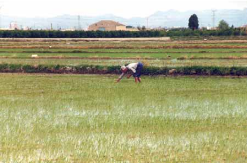
La neteja de les males herbes es fa encara a mà. (I. López)

La complicitat entre el llaurador i el parc arriba fins al punt d'establir pràctiques que ajuden a la conservació de la flora i la fauna.