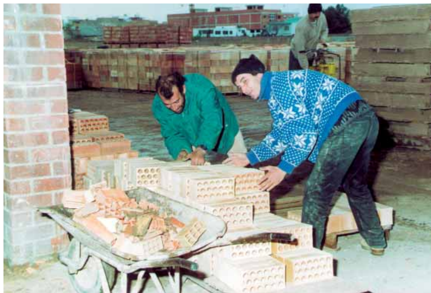
Molts rajolars tradicionals han desaparegut en no adaptar-se als nous temps.

La venda de productes il·legals, la inexistència de permisos o de factures o l'incompliment dels horaris comercials, són algunes de les irregularitats que més denuncien empresaris i comerciants respecte dels productes asiàtics.