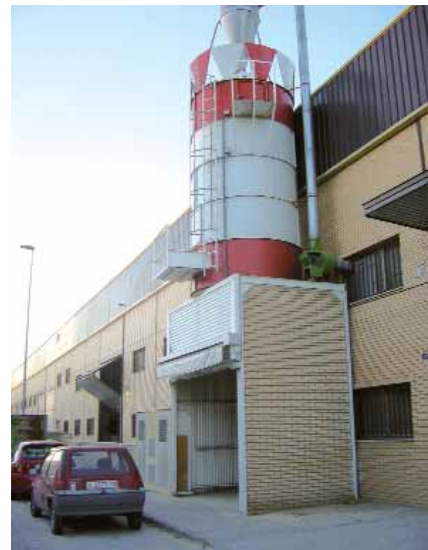
Fàbrica de taulers.

D'altra banda, la Mancomunitat ha encetat un programa de inserció laboral per a majors de 45 anys desocupats procedents dels sectors tradicionals. A més a més, la Unió Europea ha aprovat la concessió a la mancomunitat d'una subvenció d'16 milions d'euros per a finançar fins l'any 2007 un programa d'ocupació i igualtat per a les dones de la comarca. Un programa que pretén fomentar la formació ocupacional i iniciatives professionals i empresarials per a dones. ■