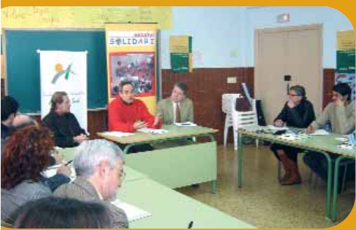
Representants de les associacions durant la Jornada.

Les associacions de la comarca analitzaren com aprofitar les lleis del mercat i com tindre una bona relació amb els mitjans de comunicació per a traslladar les seues reivindicacions al poder.