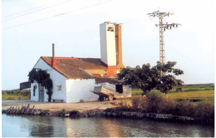
Motor del Tancat del Comú (Silla) amb el seu antic fumeral.

En l'actual conjuntura cal dissenyar estratègies que asseguruen la supervivència de l'arrossar: Juntament a l'aposta per una qualitat diferenciada dins de la Denominació d'Origen, i aprofitant també la protecció que fa el PRUG de l'arrossar, cal aconseguir ajudes de la Unió Europea no tant orientades a la producció sinó més bé incrementar la subvenció agroambiental, ja que es tracta d'un cultiu integrat en un parc natural de la xarxa del Conveni RAMSAR. És a dir, es tracta també de lligar el futur del Parc i l'arrossar als programes ambientals europeus, una vella reivindicació dels arrossers valencians que esperem es faça prompte realitat.