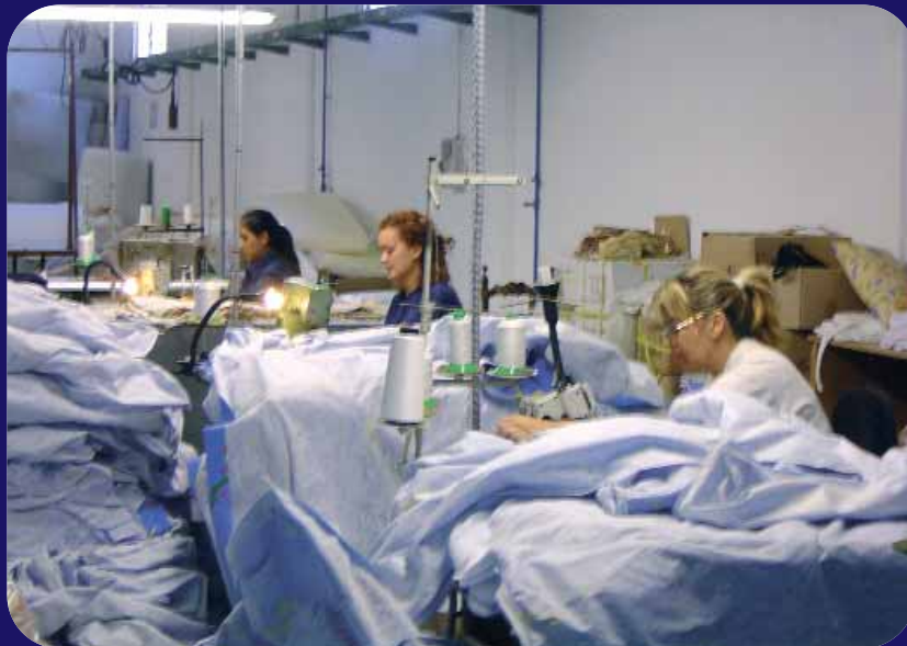
Les indústries tradicionals del moble i del tèxtil de l'Horta Sud lluiten per sobreviure a la competència dels països asiàtics, que empenen una mà d'obra barata. En la imatge, una fàbrica d'entapissats. (J. L. Carretero)

La indústria de l'Horta Sud també està patint els efectes de la nova economia global. Fàbriques tancades i centenars de treballadors que s'han quedat sense treball, són les conseqüències d'una difícil situació que ja s'ha qualificat com a crisi de la indústria tradicional, també anomenada manufacturera. L'Horta Sud té 17.600 empreses, de les quals un 28% són indústries manufactureres. Xina s'ha consolidat com el principal competidor d'aquest sector industrial.