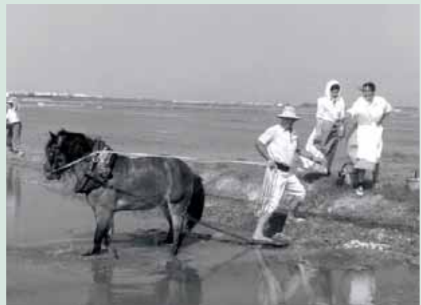
Antigament l'arrossar es llaurava amb cavall. (R. Martínez)