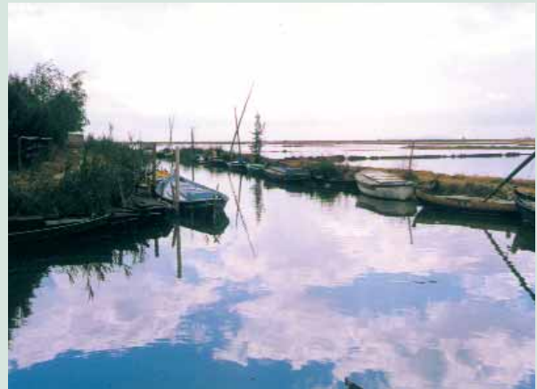
Port de Silla, al fons els "lluents" dels camps d'arròs.

S i bé el PRUG lliga indiscutiblement el futur de l'arròs al de l'Albufera, la supervivència de tot el Parc Natural (incloent l'arrossar) està unida al destí del Xúquer. La sèquia Real del Xúquer és l'artèria fonamental del llac amb els seus sobrants i filtracions als aqüífers, fins el punt que l'Albufera és una mena d'estuari del riu. Durant els últims 250 anys, el cabal del Xúquer s'ha mantingut sense variacions substancials. Però a partir de finals de la dècada de 1980 han anat minvant els cabals per les necessitats d'aigua dels nous regadius i de la indústria. Segons Acció Ecologista Agró, la situació encara pot empitjorar ja que el Pla Hidrològic Nacional preveu en la conca del Xúquer nous cabals per al transvasament Xúquer-Vinalopó i noves transformacions agràries a Castella-La Manxa. Si les actuacions previstes es duen endavant sense garantir prèviament cabals suficients per a l'Albufera, el llac es veurà abocat a una agonia de la que difícilment se'n podrà eixir.