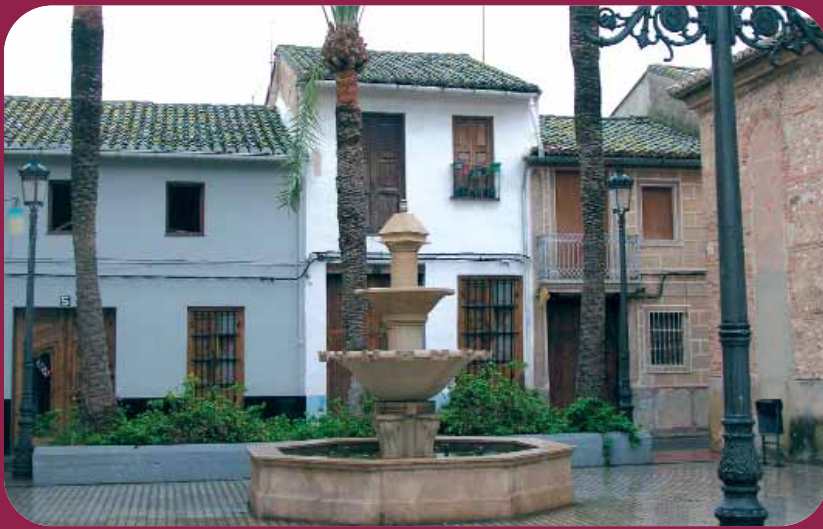
Plaça de Lloc Nou de la Corona on es troba l'Ajuntament.

Conta la història que l'origen del poble es remunta a 1676, any en què alguns frares desterrats, de l'orde franciscà de la Corona de Jesús de València, escolliren aquest indret per edificar el seu convent.