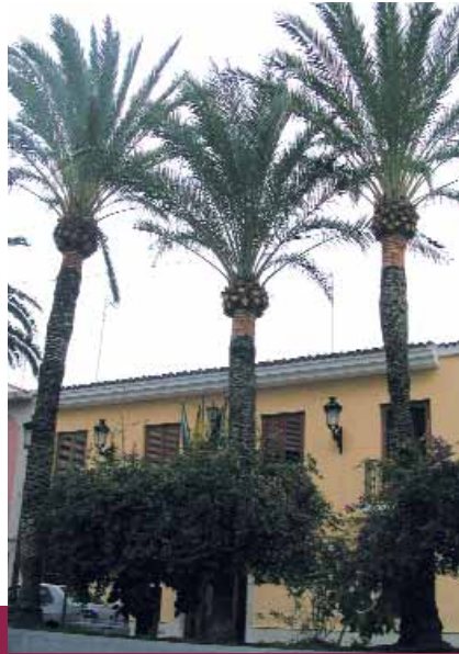
L'església parroquial i el seu voltant és el centre de la vida del poble.