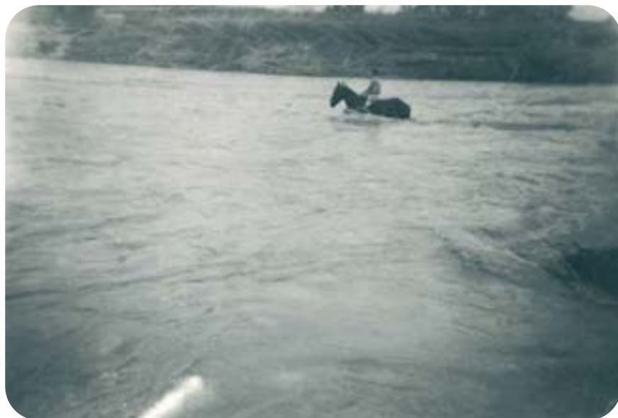
Un home travessa a cavall el riu en la riuada de 1957 a pocs metres aigües avall del pont.

Durant els anys 20 s'ha documentat, així mateix, el funcionament d'un embarcador, que possiblement va desaparèixer una dècada després. El barquer conduïa la barca i cobrava pel pas. Aquest fet posa de manifest la dificultat de travessar un pont que durant molt de temps tingué un pendent important. Això obligà a construir un gual pel qual creuaven els carros. Per a fer-lo més viable s'omplia de grava estreta del riu.