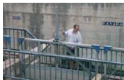
Obertura de comportes a l'assut del Repartiment.

La Comunitat de Regants de cada séquia es regeix per ordenances pròpies: les de Quart són medievals, i es remunten a 1350. En el cas que un llaurador infringisca alguna d'aquestes normes, ha de ser jutjat davant el Tribunal de les Aigües, fundat el 960