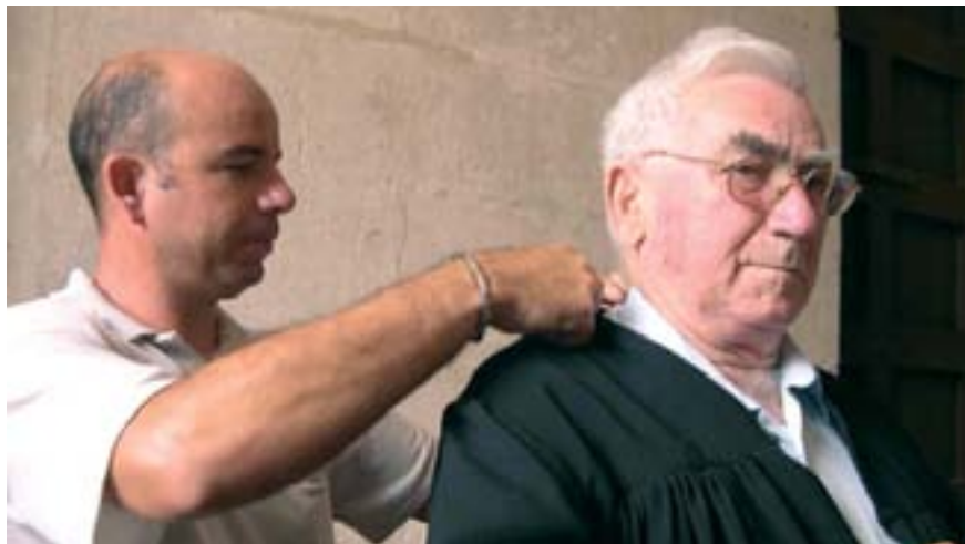
El guarda ajuda el síndic a vestir-se.