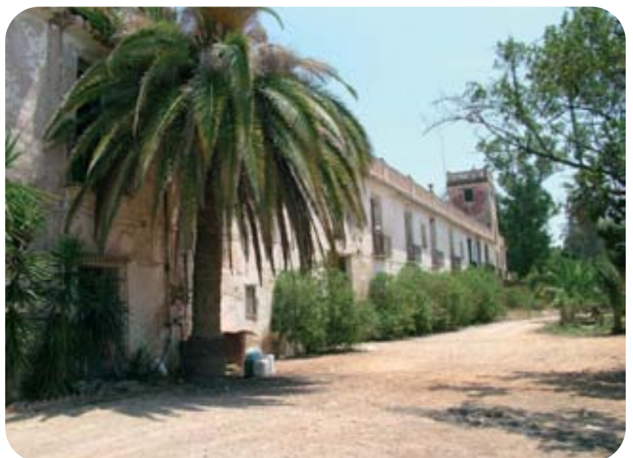
Masia de la Cova.