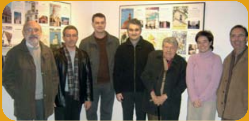
Set dels autors del llibre.

La Fundació Horta Sud recull en un llibre una recopilació d'articles publicats en la revista Papers de l'Horta sobre els vint pobles de la comarca