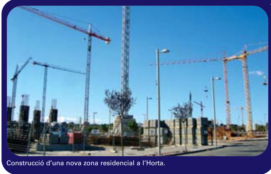
Construcció d'una nova zona residencial a l'Horta.

L'autor proposa un pacte urbanístic entre els dos partits majoritaris de les Corts Valencianes, PP i PSPV, per tal d'aminorar la febra urbanitzadora, facilitar l'accés a la vivenda i racionalitzar el desgavell urbanístic que impera a l'Horta.