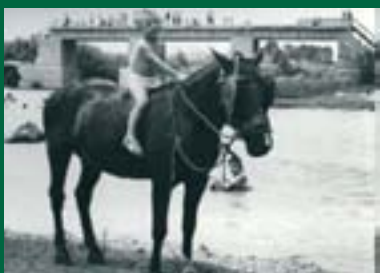
Banyes en el riu en els anys 60.