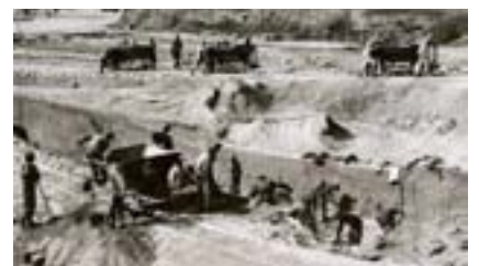
Pedrera del camp d'extermini nazi.

L'avanç de les tropes soviètiques per l'est d'Europa i el de l'exèrcit nord-americà per l'oest feia pensar que ben aviat Hitler seria vençut. El 27 de gener de 1945 els russos van alliberar el camp d'extermini d'Auschwitz, i el dia 6 de maig arribaven els nord-americans a Mauthausen: els soldats americans foren rebuts amb una pancarta que els deportats col·locaren a la part interior de la porta central on es podia llegir en espanyol, anglés i rus: " Los españoles antifascistas saludan a las fuerzas libertadoras ". La imatge que es van trobar fou horrorosa: centenars de presoners morts i amuntegats per terra, el dispensari ple de malalts agonitzant i de cossos en estat avançat de putrefacció, els barracons dels russos s'havien convertit en autèntics dipòsits de cadàvers... Finalment, el 7 de maig a Berlín, Alemanya es rendeix i finalitza la Segona Guerra Mundial a Europa. Hitler i Himmler s'havien suïcidat.