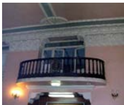
Centre Cultural i Recreatiu d'Alfatar.