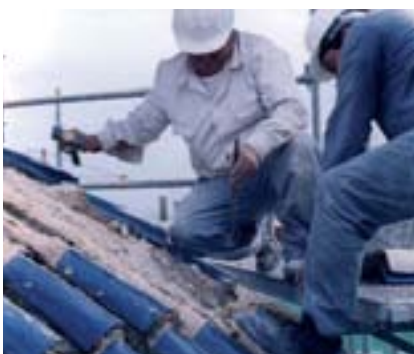
Treballs de restauració de la cúpula de l'ermita de la Mare de Déu de la Vallivana.