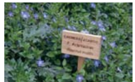
Planta autòctona de la ribera del Túria a Quart de Poblet.