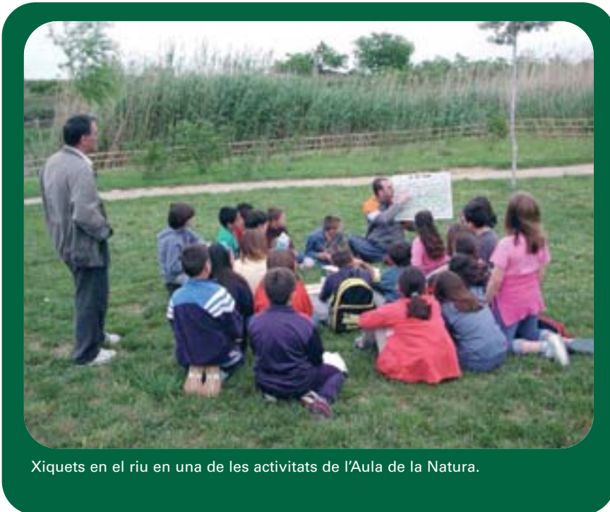
Xiquets en el riu en una de les activitats de l'Aula de la Natura.

matinada. La cisterna es troba a la plaça de l'Església, al nucli antic del municipi, mirant al riu. Actualment és utilitzada com a sala d'exposicions. En la segona meitat del segle XX, però, la gran expansió industrial va fer que el creixement del municipi s'orientara cap a la zona sud-oest del poble i l'expansió urbana generà la desaparició, que ha seguit de forma progressiva i constant, d'una part important de l'horta. El riu, amb multitud d'usos tradicionals (reg, per a fer la bugada, zona de banys o recreació, lloc per a la pesca), va emmalaltir greument per la desídia i la falta de sensibilització. La contaminació va arribar a extrems més que alarmants.