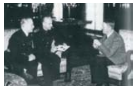
Serrano Súñer (al centre) amb Hitler.

El primer grup d'espanyols que fou deportat al camp d'extermini austríac de Mauthausen estava format per 392 republicans tots procedents de l' stalag VII-A (Moosburg bei Freising) i tingué lloc el 6 d'agost de 1940. A partir d'aquesta data, i fins al 16 d'abril del 1945, les deportacions d'espanyols es produïren de forma continuada amb la col·laboració del mariscal Pétain i amb el beneplàcit del general Franco. El govern espanyol, i en particular el seu ministre d'Afers Estrangers Ramón Serrano Súñer, estaven perfectament assabentats del martiri que estaven patint els soldats espanyols republicans, com s'ha demostrat documentalment mitjançant la correspondència que es mantingué amb el cònsol espanyol a Viena i l'ambaixador espanyol a Berlín. La deportació a Mauthausen continuà periòdicament fins a vint dies abans de l'alliberament per les tropes aliades: el 5 de maig de 1945.