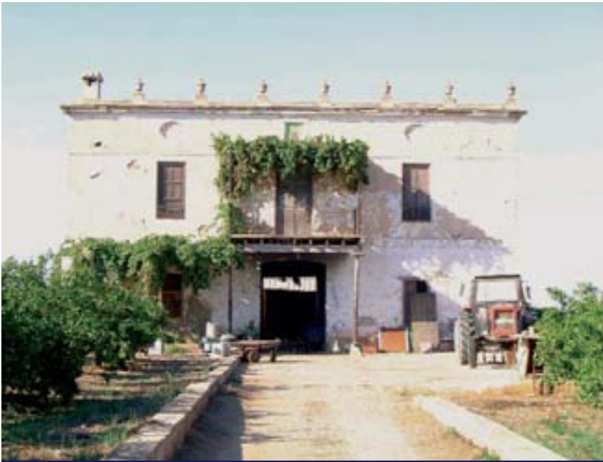
Hort del Groc de Catarroja (J.L. Carretero)

La Comissió Europea –a petició del Parlament Europeu– ha recomanat a la Generalitat Valenciana una moratòria urbanística, és a dir, la no reclassificació de més terrenys per a construir, i també la paralització dels PAI en tramitació fins que no s'aprove la LUV.