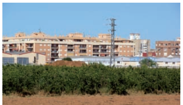
Els límits de l'horta arriben a la mateixa porta dels pobles.