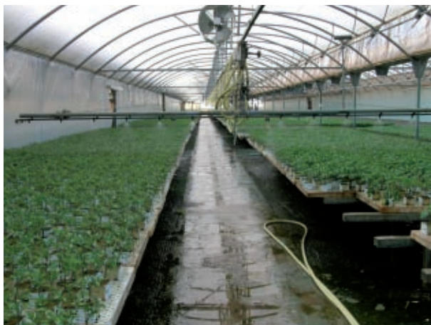
Els hivernacles han impulsat el sector d'hortalisses.

S'aporten els mapes corresponents als sòls agrícoles de màxima qualitat (verd), altres sòls rurals (groc) i sòls no agrícoles o urbans (roig) segons les dades CORINE per als anys 1990 i 2000. Les dades corresponents al 2006 encara no són oficials. En la taula de superfícies s'aprecia que la superfície agrícola ha baixat en 1.318 ha a la comarca de l'Horta i en 952 ha en l'àmbit del PAT de l'Horta. Del període 2000-2010 no tenim dades, però considerant el boom immobiliari del període 1999-2007, és previsible que el ritme de transformació no haja canviat.