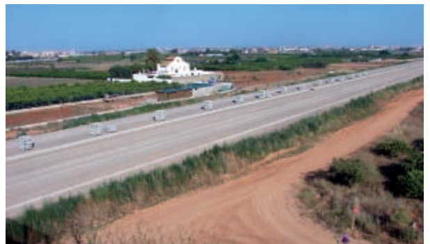
Impacte de les obres de l'AVE a l'Horta Sud.