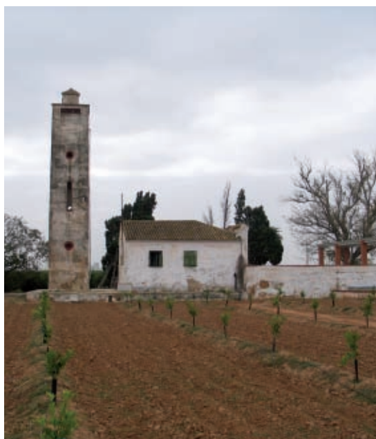
Els cítrics mantenen viva la tradició agrícola valenciana.

passa amb les caixes: els polítics les utilitzen per a aconseguir els seus interessos a curt termini i per això no funcionen. La ineficiència de les proteccions administratives del territori ha quedat en evidència ja moltes vegades (les Normes Metropolitanes de Coordinació, la ZAL del port de València...). Si no es genera una estructura administrativa que garantisca els interessos ambientals a llarg termini enfront dels interessos conjunturals, mai no es podran aconseguir els objectius de sostenibilitat. Per això cal un Banc de Capital Natural gestionat per tècnics amb objectius clars i sense cap polític de cap tipus en la seua estructura organitzativa. Aquesta organització ha de ser la responsable de mantindre les proteccions territorials davant els interessos conjunturals de les administracions.