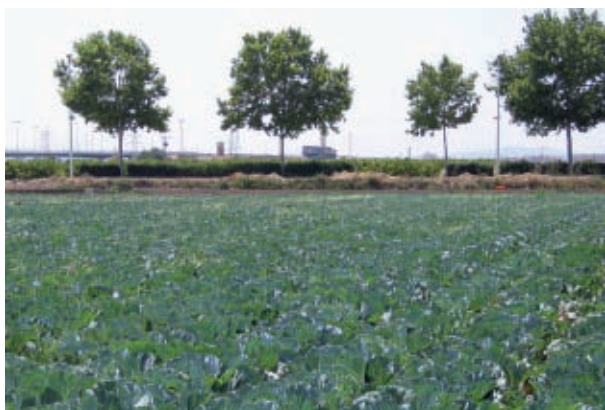
La comarca ha perdut 1.320 hectàrees de sòl agrícola en el període 1990-2000.

Segons la publicació Capacitat d'ús dels sòls de la Comunitat Valenciana de la Generalitat Valenciana (1998), 5 només hi havia un total del 3,9% de sòl de màxima capacitat agrícola (capacitat agrològica del sòl tipus A) al País Valencià. Això significa unes 88.000 ha dels 23.255 km 2 (2.235.500 ha) de territori valencià. Aquestes 88.000 ha es repartien principalment entre la Vega Baixa del Segura i l'Horta de València. Segons les dades de CORINE, la superfície artificial real a la Comunitat Valenciana s'ha incrementat de manera notable des de 1990 fins a l'actualitat. Les dades CORINE, una base europea de dades geogràfiques obtin-