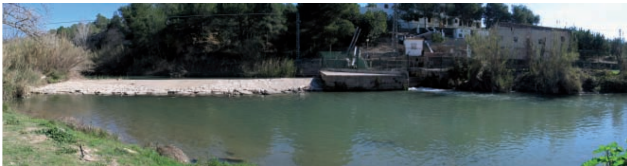
Assut de Montcada al riu Túria.

cada vegada més l'economia productiva. Quan el procés s'atura, es tallen els ingressos de colp, tanquen les empreses, el sector immobiliari queda sobredimensionat i es converteix en una font d'aturats de molt difícil reconversió. A hores d'ara crec completament evident que l'especulació va en contra del progrés i que genera crisis econòmiques de molt difícil solució. És pa per a hui i fam per a demà. Per tant, s'hauria de tancar, falcar i bloquejar aquesta porta. Hi ha una manera molt senzilla de fer-ho: reduir la gestió del sòl urbanitzable al sistema d'expropiació. L'ajuntament expropia els terrenys al preu taxat, costea les obres d'urbanització i adjudica drets de superfície sobre les parcel·les produïdes per a edificar. Així recupera la inversió. El comprador de l'habitatge paga l'habitatge, però no el sòl que continua sent de titularitat pública. Hauria de ser una mesura contundent per tal que ningú, absolutament ningú, pense que pot enriquir-se especulant. Òbviament, els especuladors –és a dir, els qui han causat la crisi econòmica en què estem– no volen.