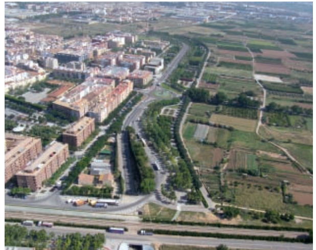
Vista aèria d'Aldaia, on es veu el Cinturó Verd de protecció de l'horta (a la dreta de la imatge). El PGOU d'Aldaia qualifica l'horta com a sòl agrícola no urbanitzable.

La primera activitat va consistir en el nomenament per part de les Corts Valencianes dels fedataris (unes 250 persones amb les quals varen col·laborar altres 150 persones) que, sota jurament, havien de donar fe de l'autenticitat de les firmes que s'anaven a recollir corresponent a les dades personals incloses en el cens