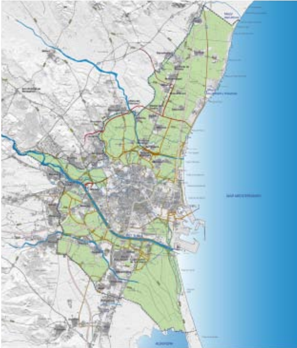
PI-17. Infraestructures planejades. Pla d'Acció Territorial de Protecció de l'Horta de València.