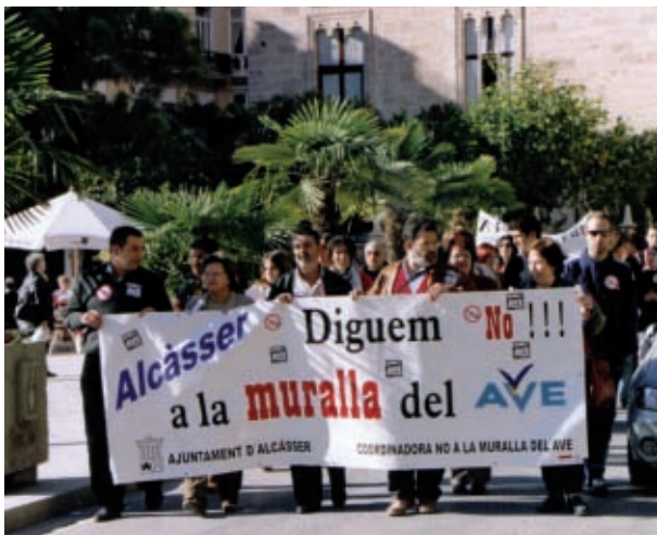
Manifestació contra les obres de l'AVE a l'Horta.

tencions contra el projecte de canalització del barranc del Carraixet per no disposar d'un estudi d'impacte ambiental. El contencios es va guanyar per sentència del Tribunal Suprem, que va declarar nul de ple dret l'acte d'aprovació del projecte en 1997 i retrotragué els actes administratius al moment anterior a l'aprovació del projecte, tot quan les obres ja estaven completament executades. Així es demostra la ineficàcia del dret ambiental davant de processos irreversibles si no hi ha una paralització preventiva del projecte causant del dany.