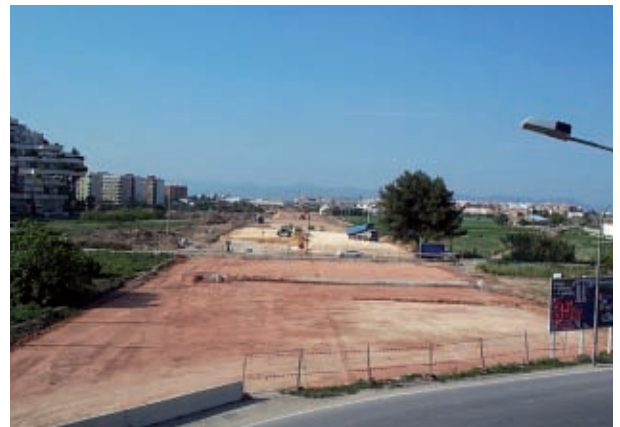
Obres de la Ronda de València, a Germans Machado. El pi ja s'ha secat.

ciutadà en el període de 1987 a 1992. El moviment s'agrupa entorn de l'anomenada Coordinadora per la Defensa de l'Horta. La darrera intervenció d'aquest moviment fou la interposició en 1992 d'un recurs con-