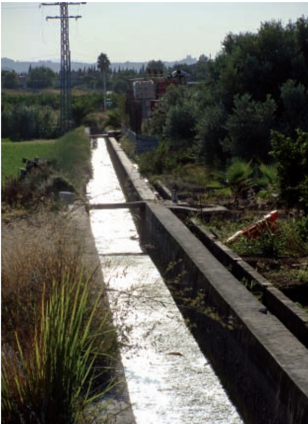
L'Horta Sud també és regada per la Séquia Reial del Xúquer.

El plànol d'infraestructures planejades ens mostra tota una xarxa metropolitana viària que, en la major part, corresponen a iniciatives de la Conselleria d'Infraestructures que es donen per assumides quan no s'ha produït cap procés de participació pública, de justificació en un document de planificació ni d'avaluació estratègica ambiental. Hi ha una contradicció frontal entre els objectius del PAT i les formes i iniciatives per a la infraestructura viària metropolitana.