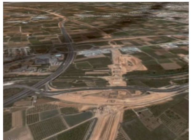
Impacte de les obres de l'AVE a l'Horta Sud.

Extremadament significatius són els plànols d'informació PI-17 sobre infraestructures planejades, el PI-14 sobre qualificació del planejament vigent a l'abril de 1998 i els plànols d'ordenació en què s'assenyalen projectes d'infraestructures i reclassificacions contradictòries amb els objectius del PAT.