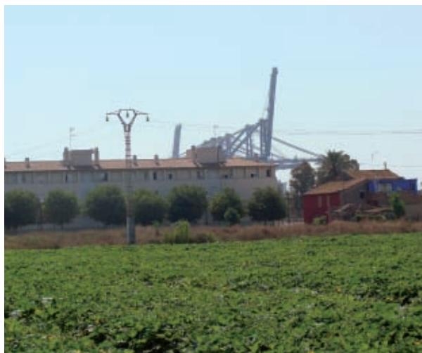
Explotació agrícola a Albal.

De fet, en aquesta època la Plataforma valorava la possibilitat de promoure la Iniciativa Legislativa Popular amb l'objectiu de protegir els espais d'horta de manera general. Però, el necessari esforç per a arrebregar el mínim de 50.000 firmes de suport i la nul·la garantia, en cas de tindre èxit, que el text fóra aprovat per les Corts Valencianes, eren importants arguments en contra de la iniciativa. Finalment, es decideix de promoure la Iniciativa Legislativa Popular, potser amb una ingènua fe en la democràcia i que els representants democràtics la considerarien, tot valorant que el procés de participació ciutadana generaria una conscienciació popular i organització del moviment ciutadà. Per això es planteja des del principi obtindre no el mínim, sinó el màxim de firmes possibles i la màxima repercussió social.