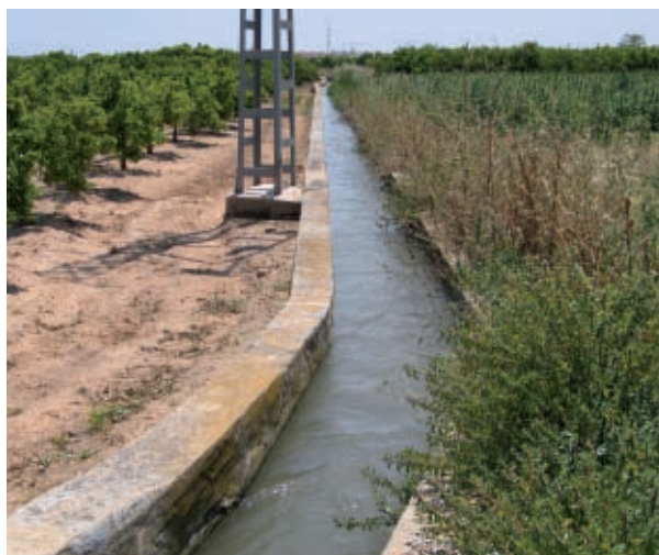
Les séquies del Túria alimenten l'horta.