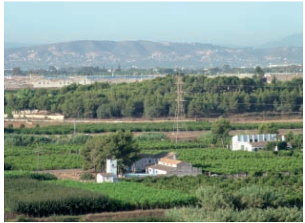
Zona agrícola de Manises.

text i demanant el rebuig per part de les Corts sense debat. El Partit Socialista, principal partit de l'oposició, va defensar el procés de participació però no les propostes. Va ser defensada per l'alcalde de Torrent, que en aquell moment estava promovent un projecte urbanístic de 100 ha en terres d'horta. En la pràctica, sense dir-ho, defensaven que els ajuntaments puguen continuar ingressant diners a partir d'operacions immobiliàries urbanitzant l'horta. Tot en contra d'estratègies establides en l'Estratègia Territorial Europea. 10 En l'argumentació utilitzada per a rebutjar la proposta, un dels principals arguments fou el compromís per part del Govern valencià de redactar i aprovar una Llei d'Ordenació del Territori que, alternativament a la proposta, havia d'abordar els problemes i plantejar les solucions.