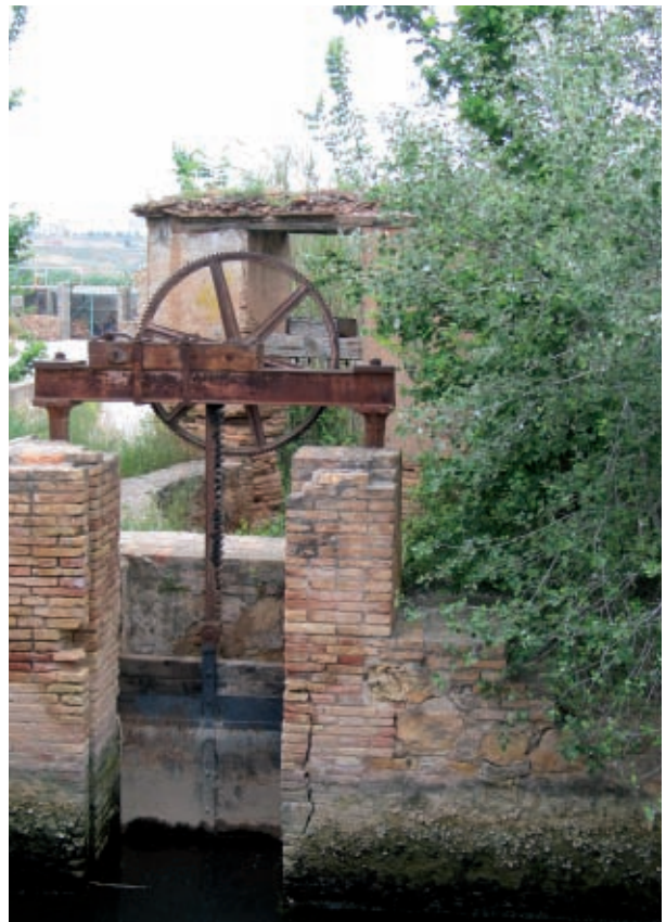
Fesa de reg de l'horta.

Justament per això, en la ILP s'apostava per un òrgan tècnic i no polític, de manera que, quan estiguera protegida una zona, la desprotecció no fóra responsa-