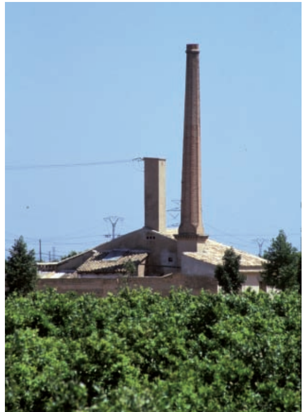
L'horta sobreviu assetjada.

Per tant, ja l'any 2000 la superfície de sòl transformat superava la superfície de les terres agrícoles de màxima qualitat, de manera que són aquestes i no l'extensió de ciutat l'element territorial que cada any és més escàs. Aquest fet posa en evidència el problema de fons de la sostenibilitat: els recursos naturals (en aquest cas, terres agrícoles de màxima qualitat) es transformen de manera pràcticament irrecuperable i són substituïdes per trama urbana en processos de caràcter especulatiu que suposen ingressos immediats i costos per al futur amb els recursos disponibles disminuïts. Aquestes superfícies agrícoles continuen desapareixent i en la informació del PAT de l'Horta exposat en el web de la Conselleria de Medi Ambient, Aigua, Urbanisme i Habitatge de la Generalitat Valenciana, es