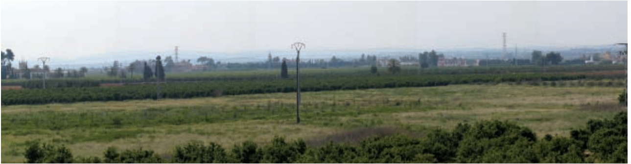
L'horta periurbana està molt degradada a causa de la pressió urbanística.

Els problemes de fons continuen sent els mateixos i, una vegada més, han quedat en evidència: